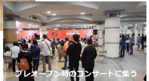
プレオープン時のコンサートに集う