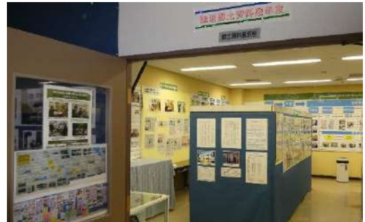
鵜沼郷土資料展示室 入り口