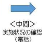
＜中間＞ 実施状況の確認（電話）