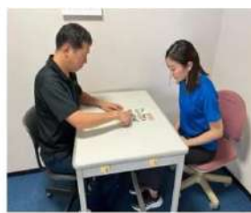
＜1ヶ月後＞ からだの状態を確認し、運動継続に向けてのアドバイス

対象：市内在住65歳以上の方 費用：無料 場所：藤沢市保健医療センター3階 申込み・問合せ：藤沢市保健医療センター 保健事業課 電話：0466-88-1416